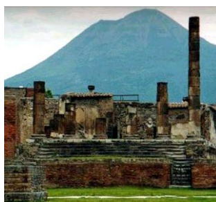
Napoli / Vesúvio