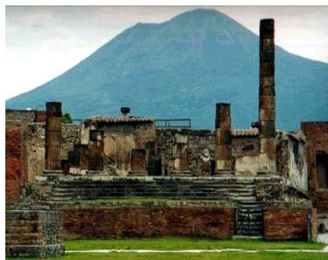
Napoli / Vesúvio